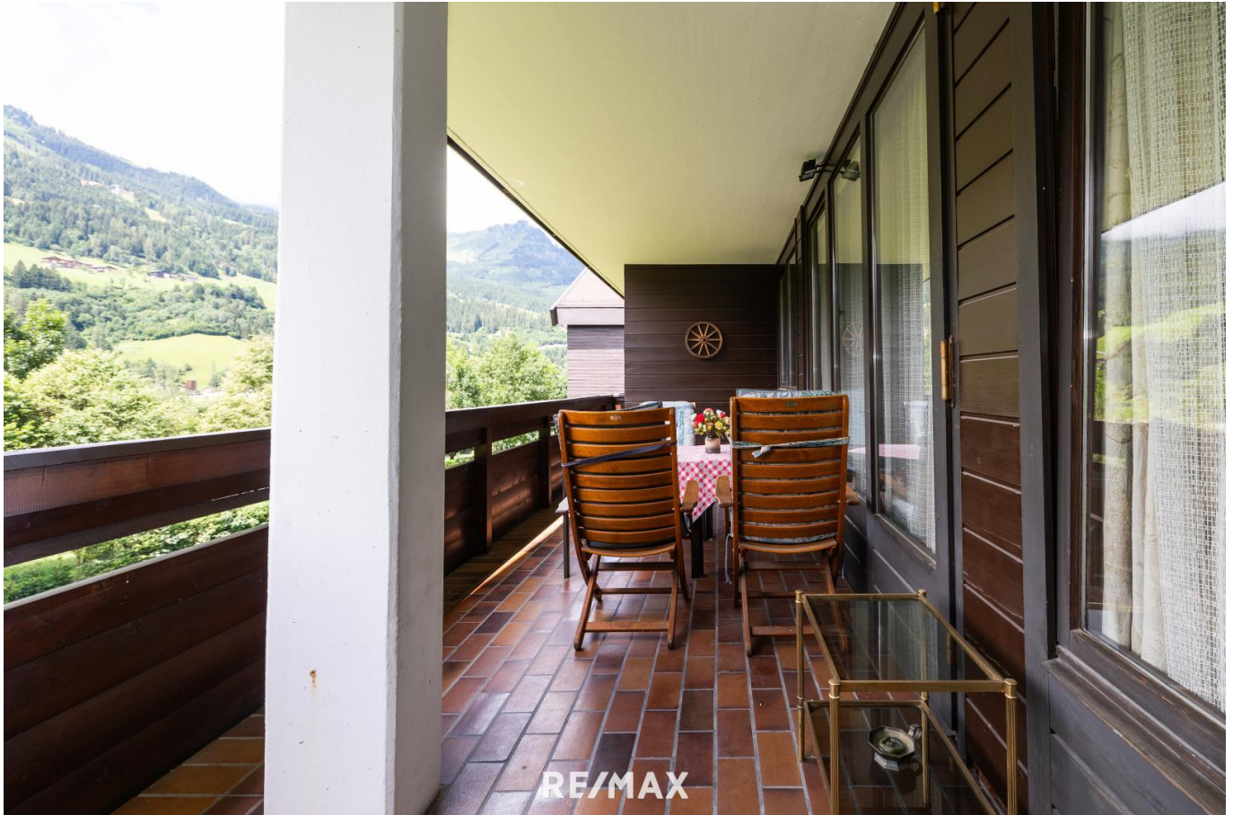
Balkon Ansicht 1