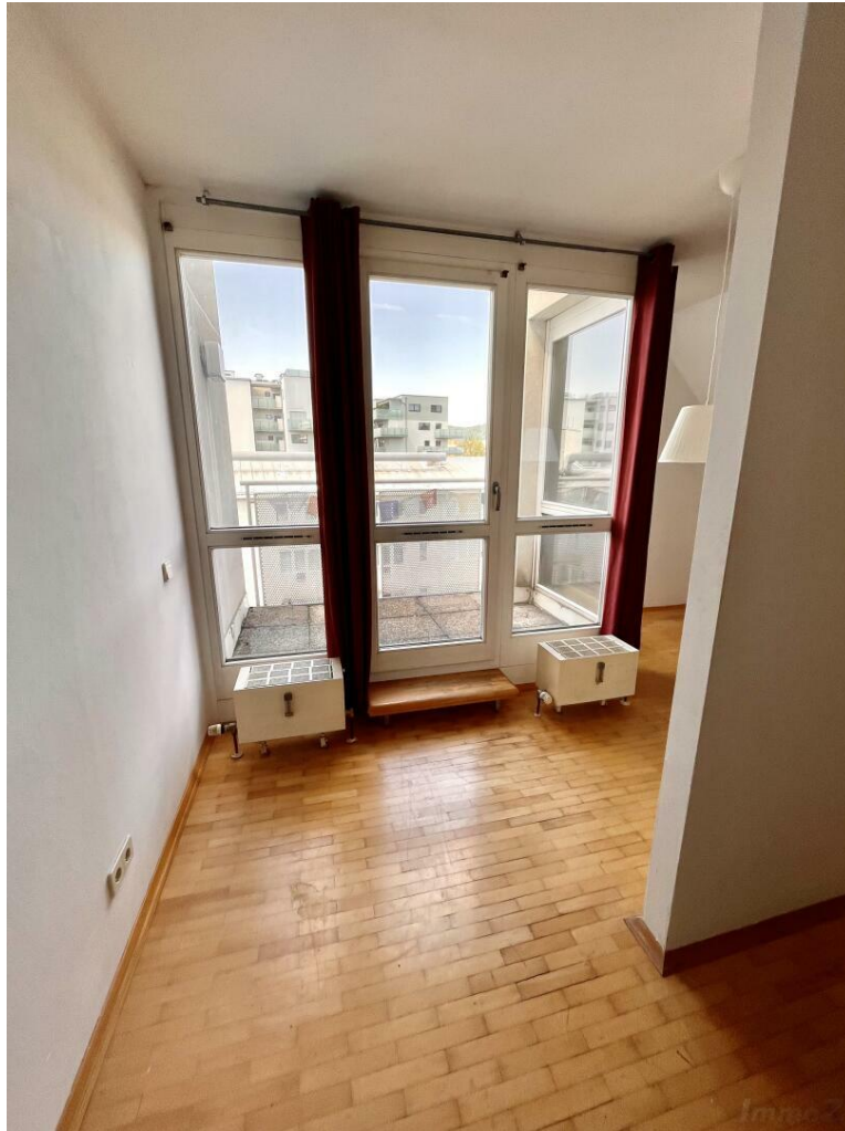
Ausgang zum Balkon