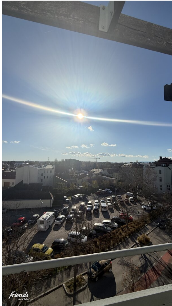
Aussicht kleiner Balkon