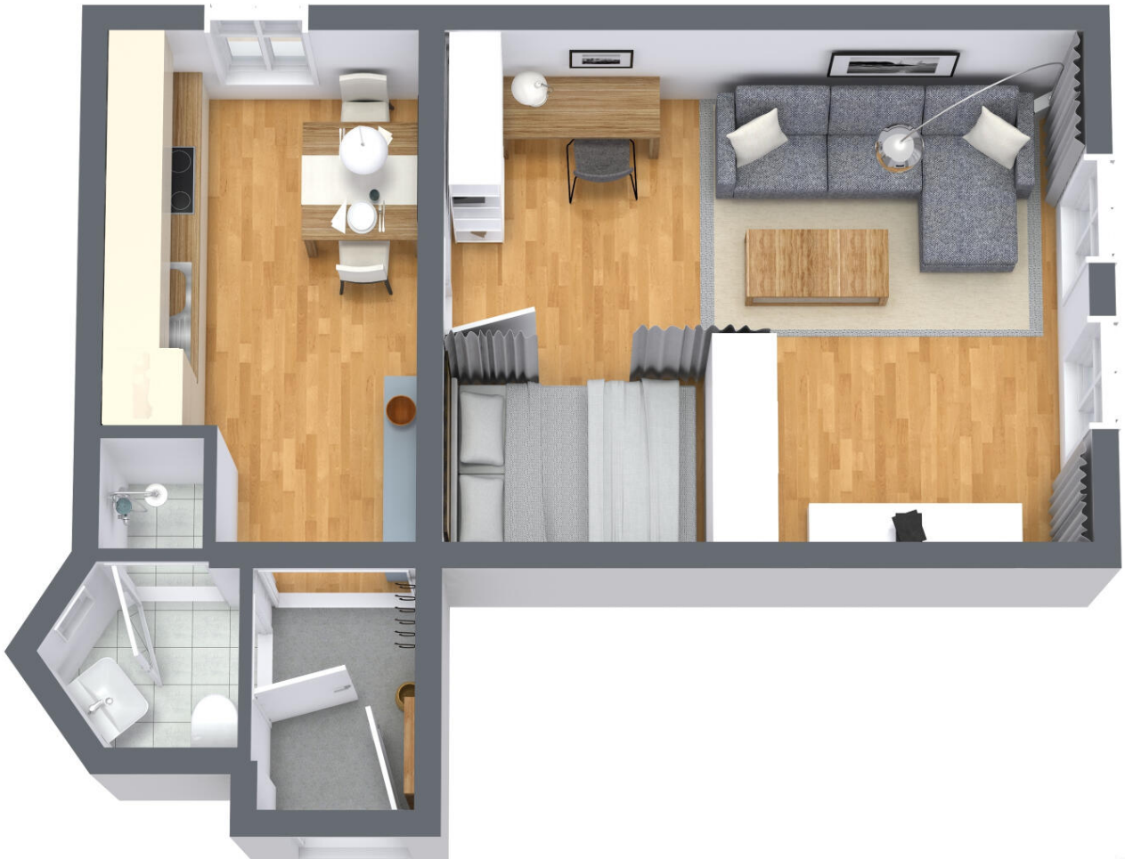
TF Reininghausstraße 79 - 1. Etage - 3D Floor Plan