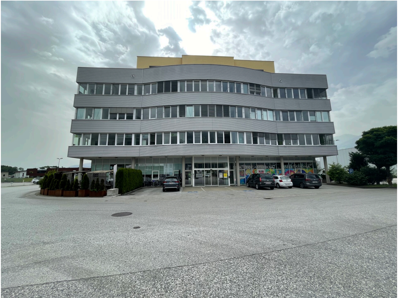
Außenansicht / Eingang