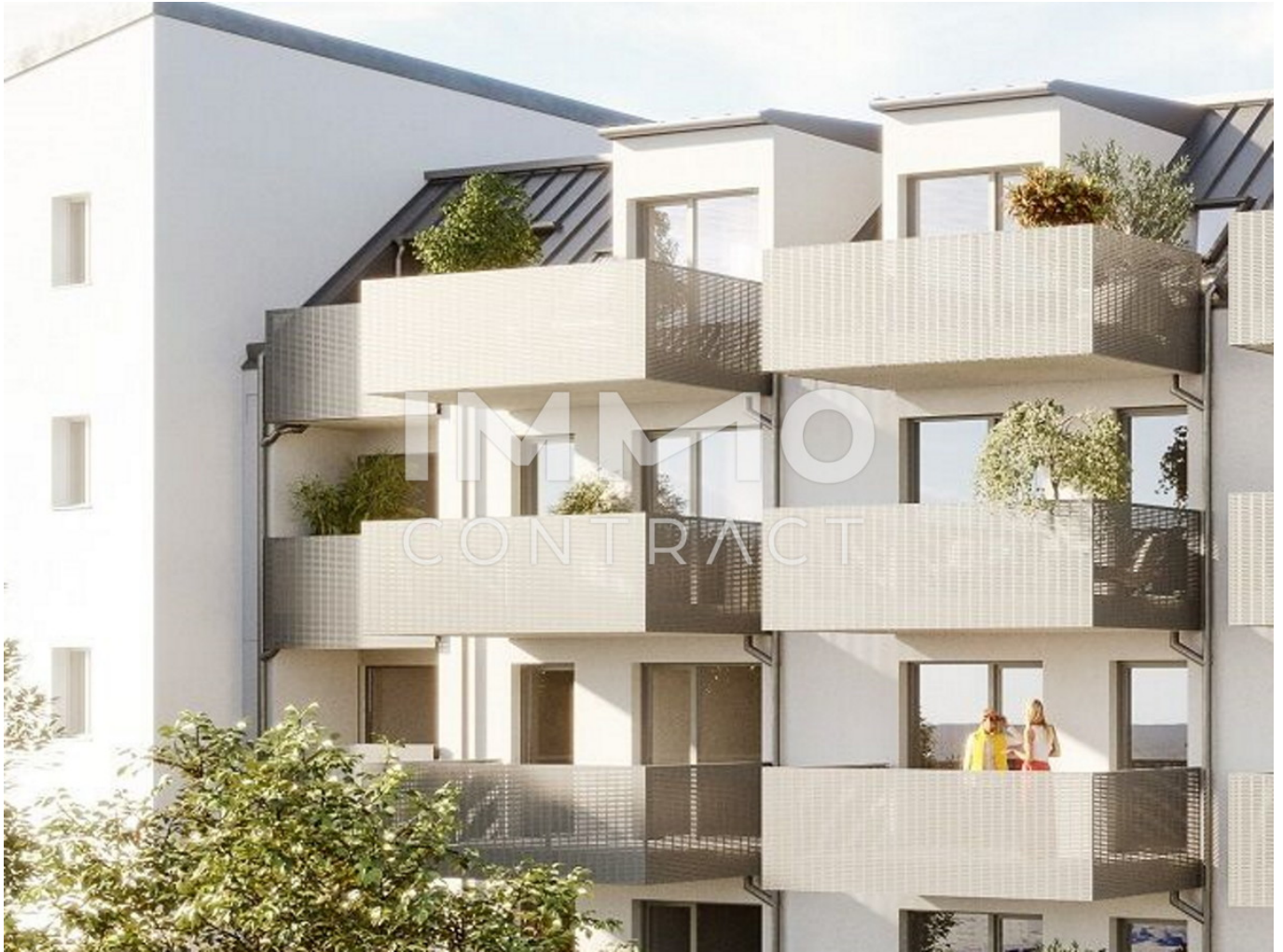
Balkonien Links mit Dach