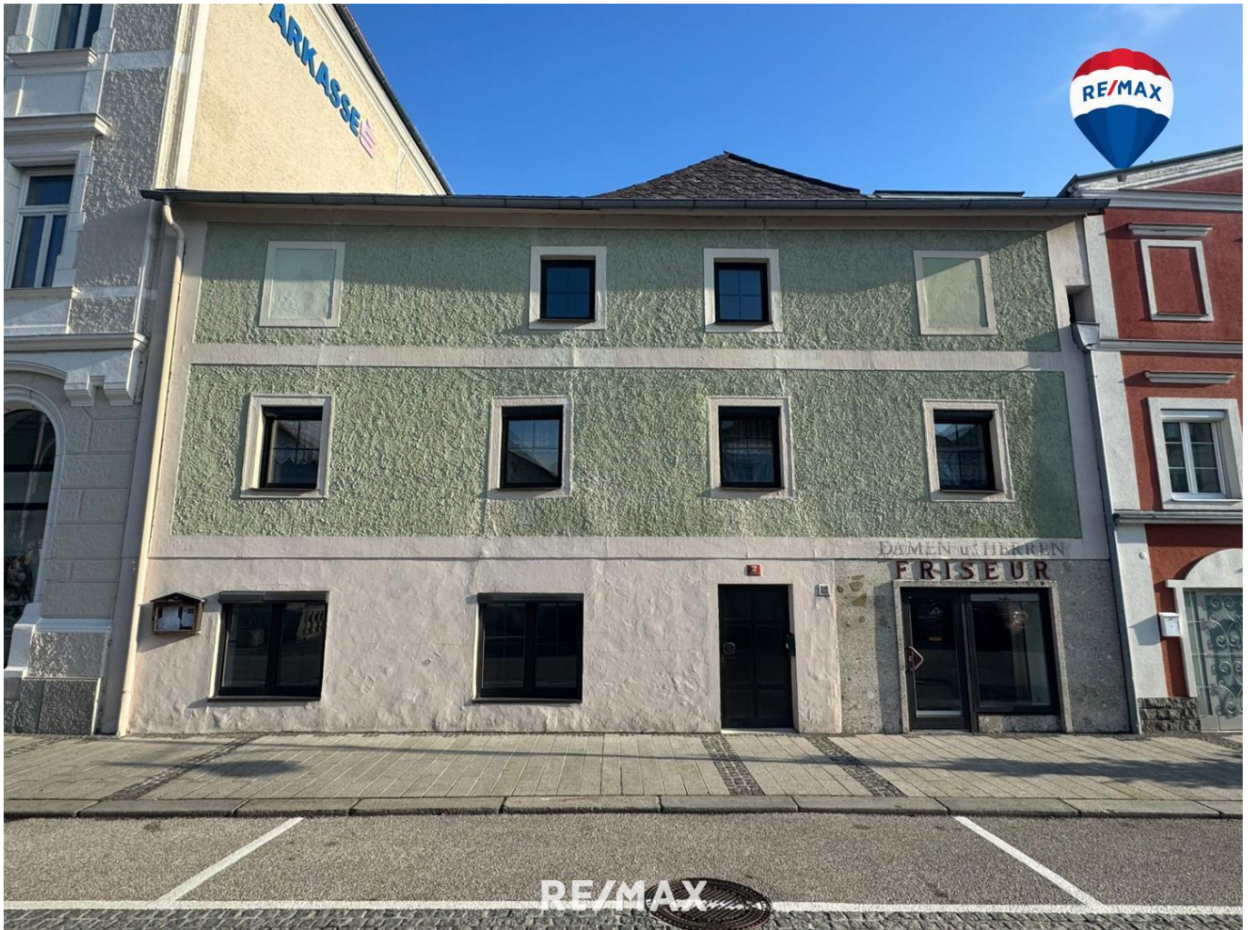
Titelbild Ansicht Stadtplatz