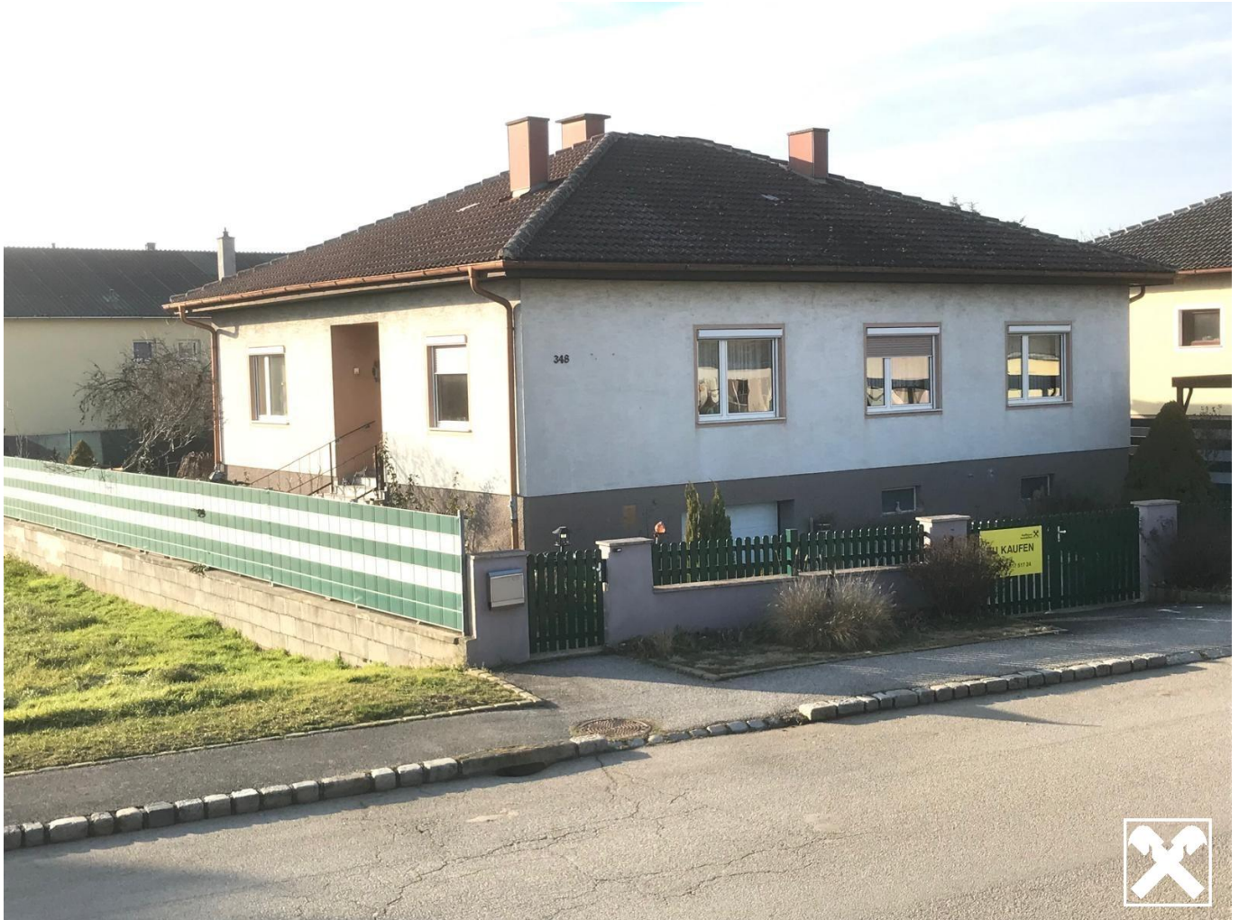
Ansicht von Straße