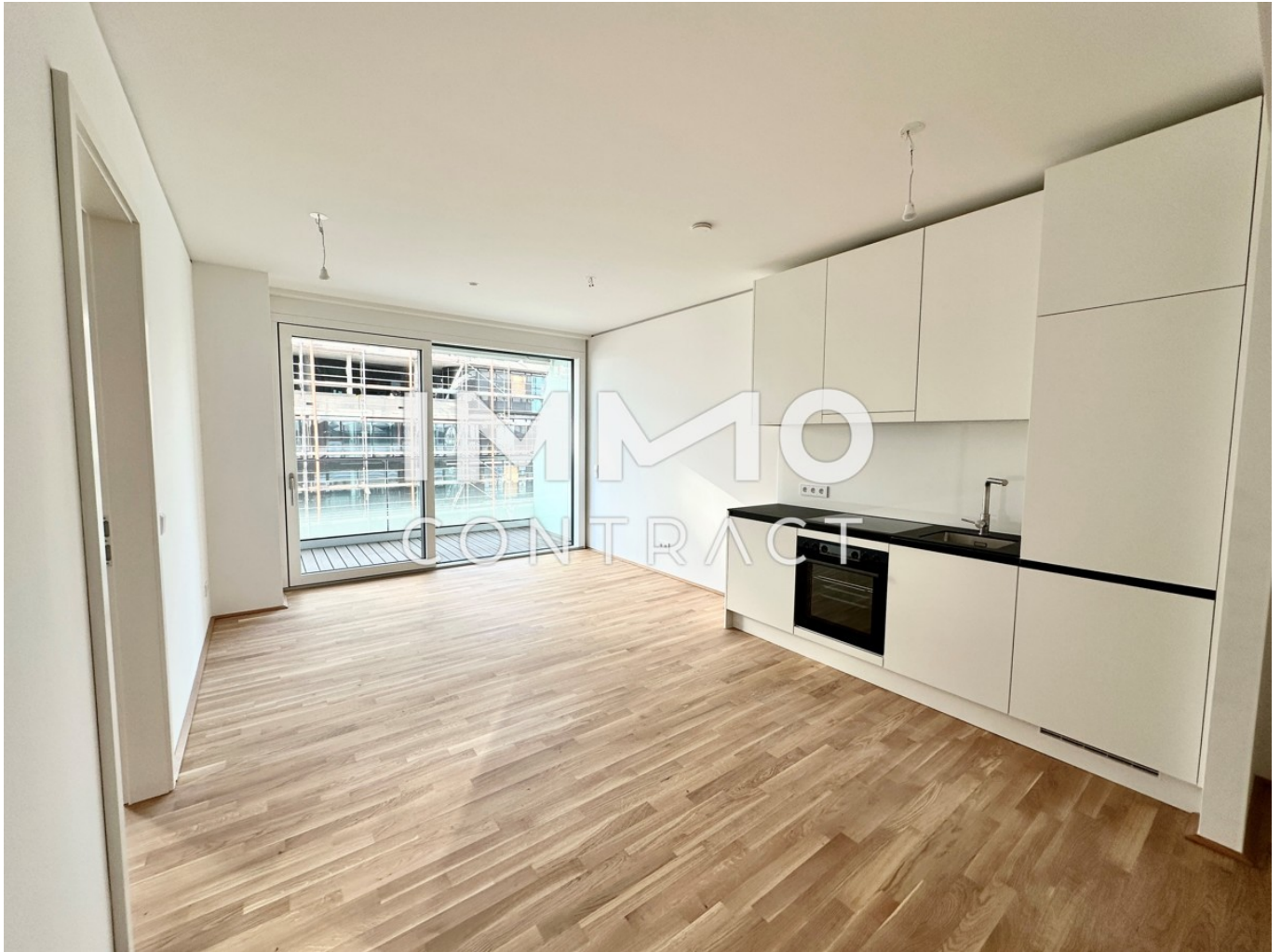
View 2 Zimmer 1