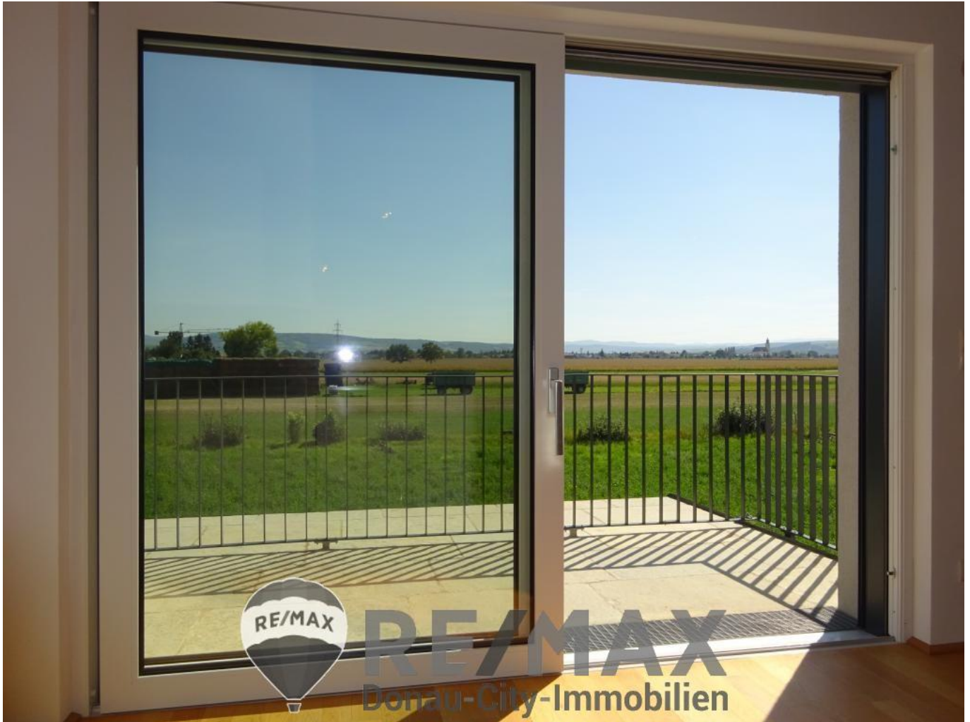
01 Ausblick Terrasse