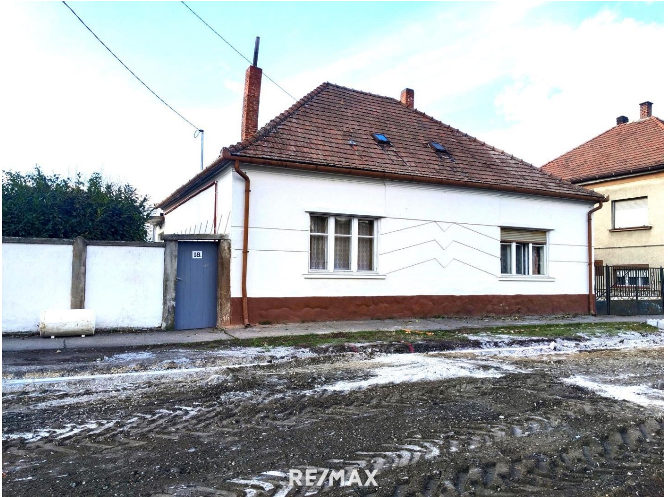
1. Haus Straßenansicht