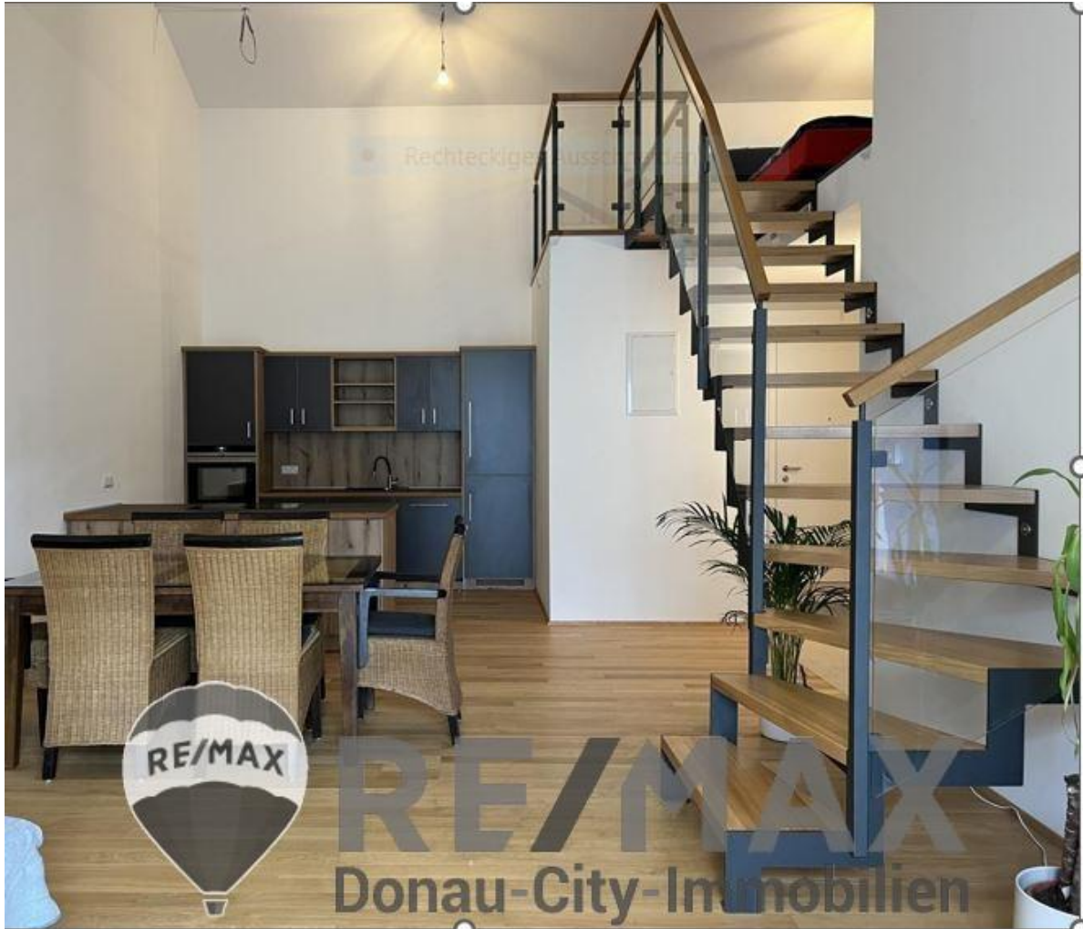
Küche/Essbereich mit Aufgang zur Galerie