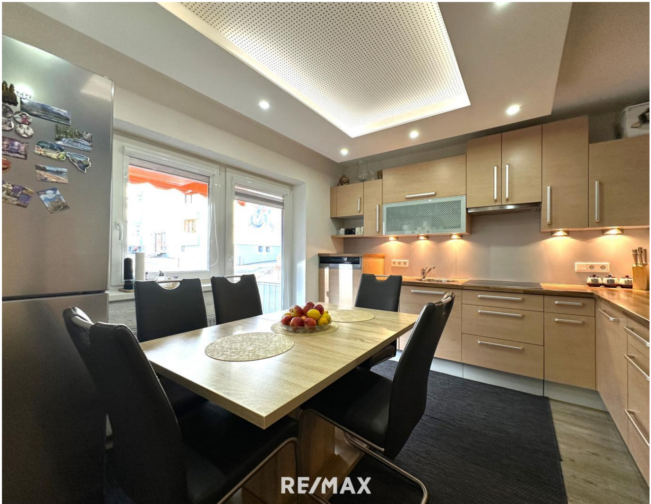
Wohnung - Koch- und Essbereich