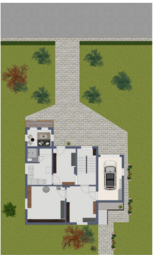
RE/MAX Eigenschaften, nicht realisierbar