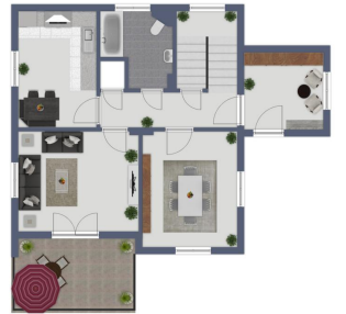
RE/MAX Eigenschaften, nicht realisierbar