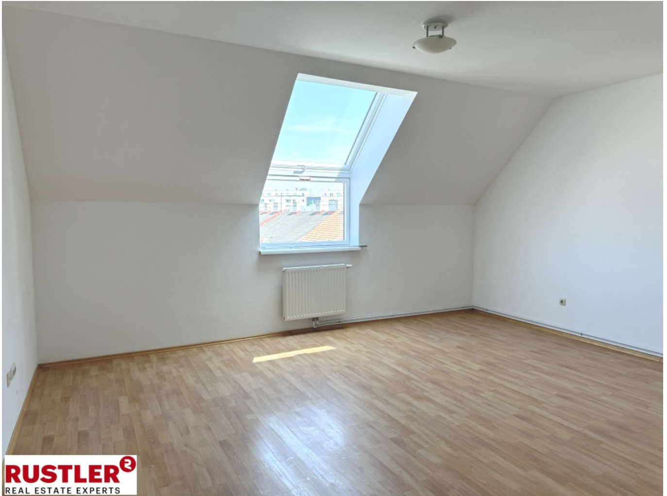
Wohnraum Ansicht 2