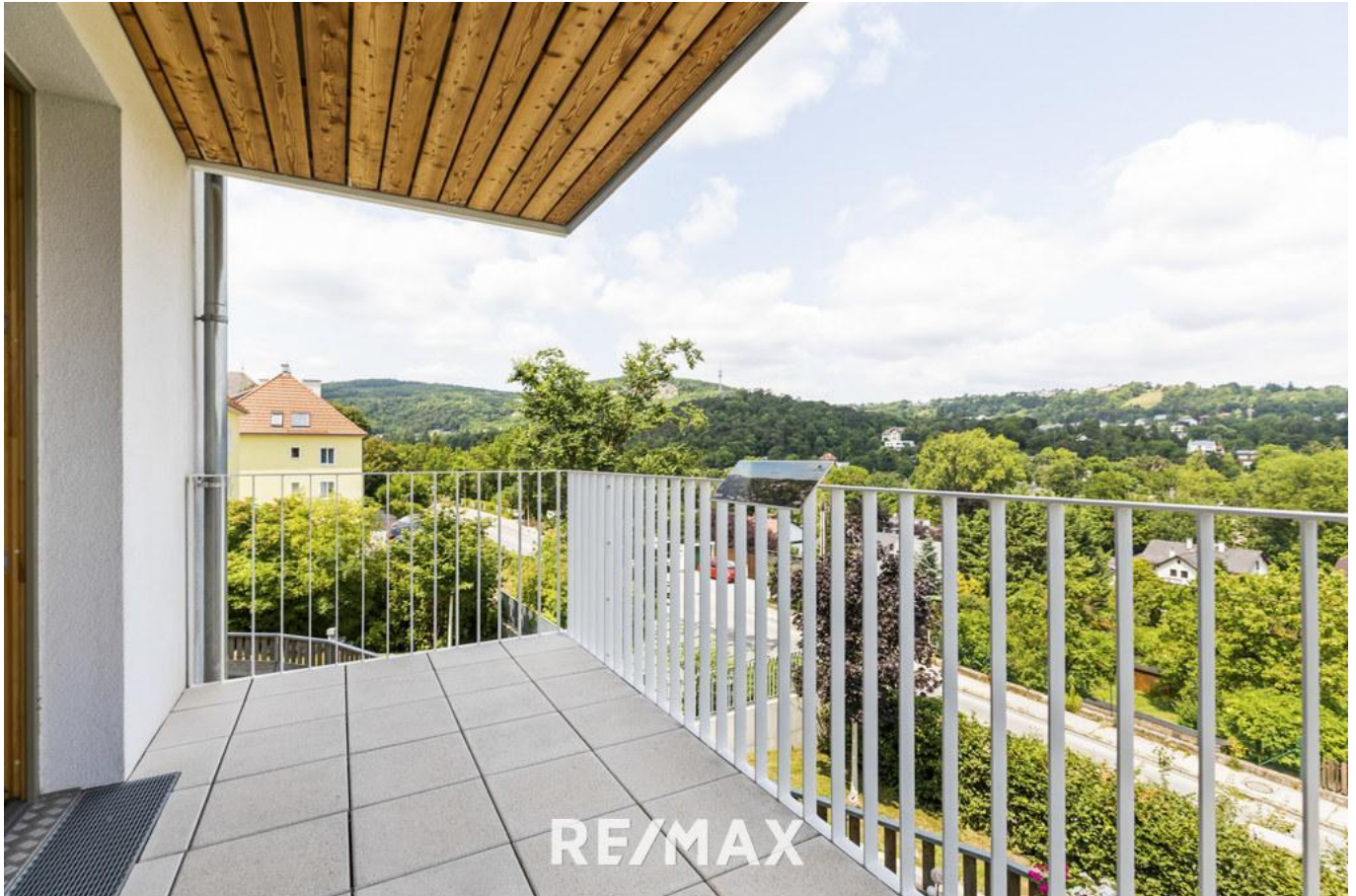
Balkon mit Aussicht

Objektnummer: 1609_42364 Eine Immobilie von RE/MAX First