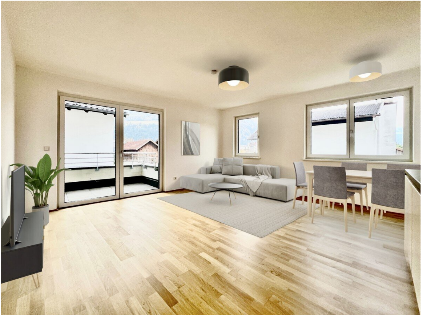
Rendering - Heller und großzügiger Wohn- und Essbereich mit Zugang auf den Balkon