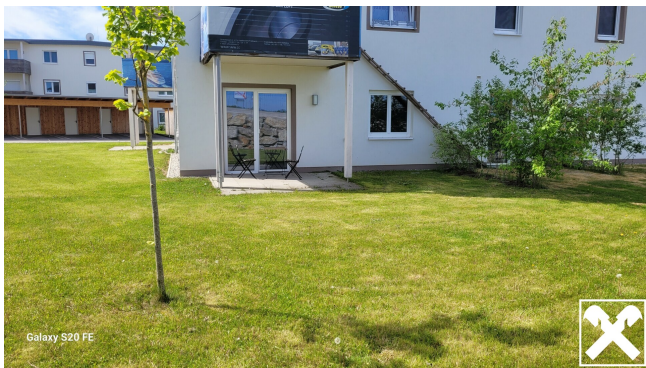
Galaxy S20 FE