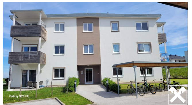
Galaxy S20 FE