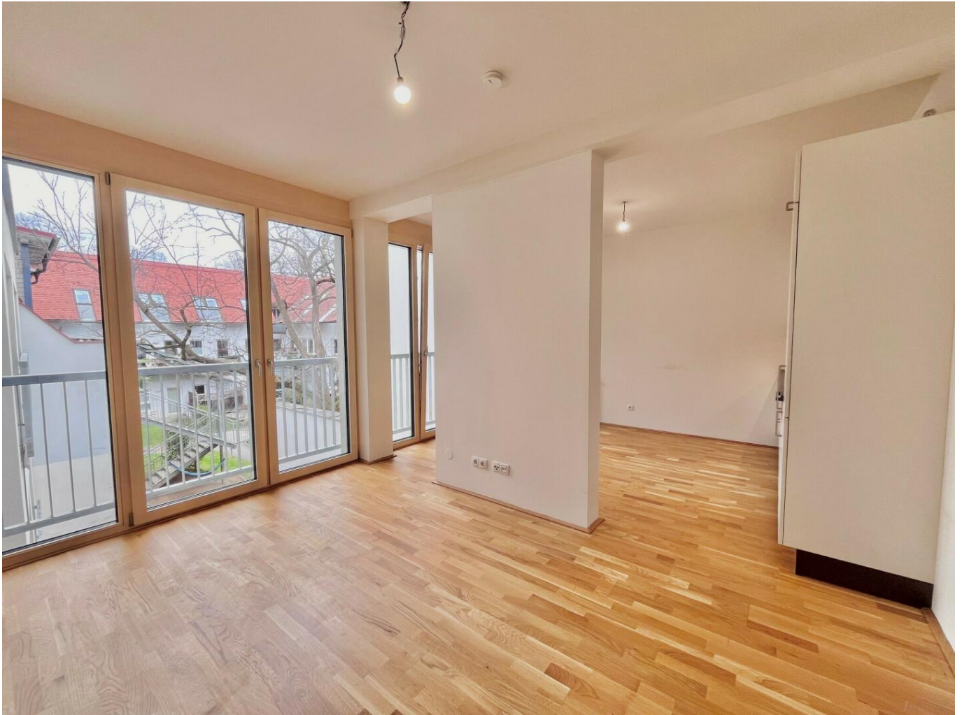
Wohn-/Essbereich mit integrierter Küche