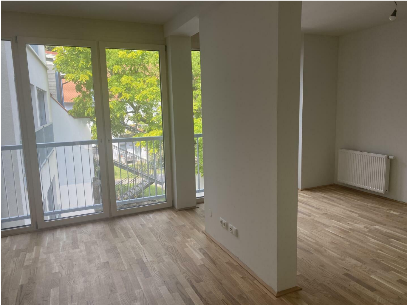
Wohn-/Essbereich mit offener Küche