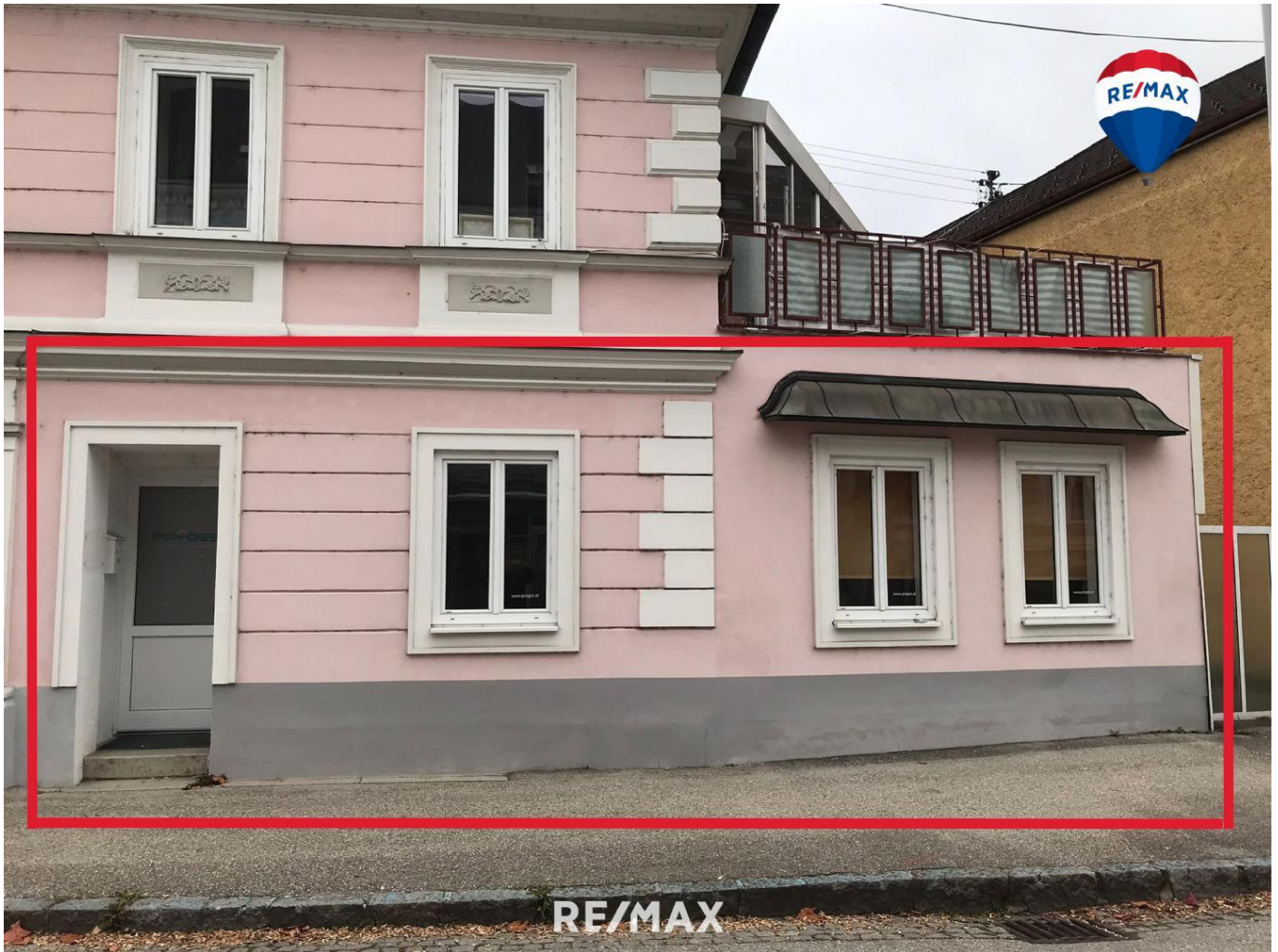
Titelbild - Mietobjekt markiert