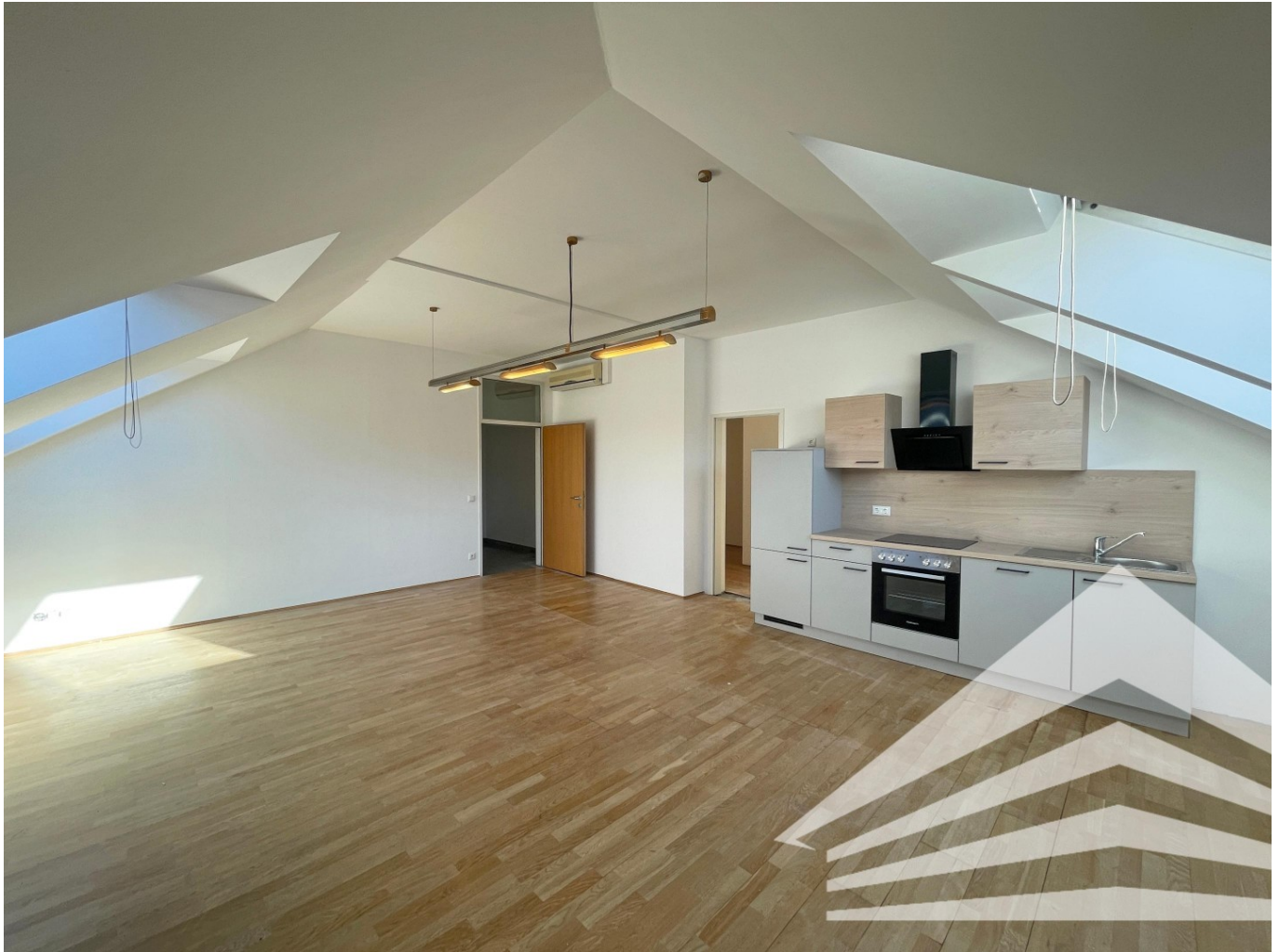
Wohn-/Essbereich inkl. Küche