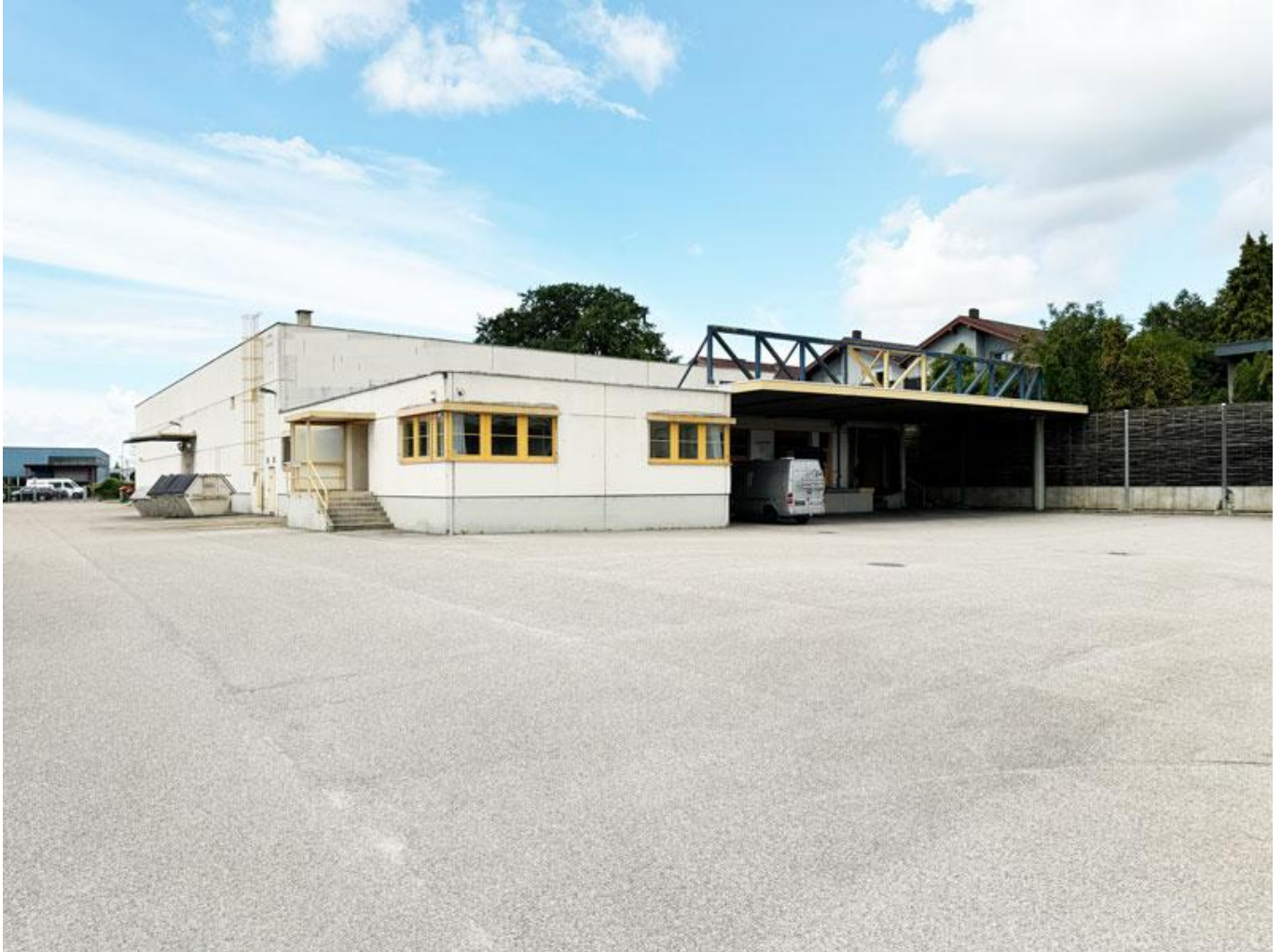
Halle mit Büros und Freifläche