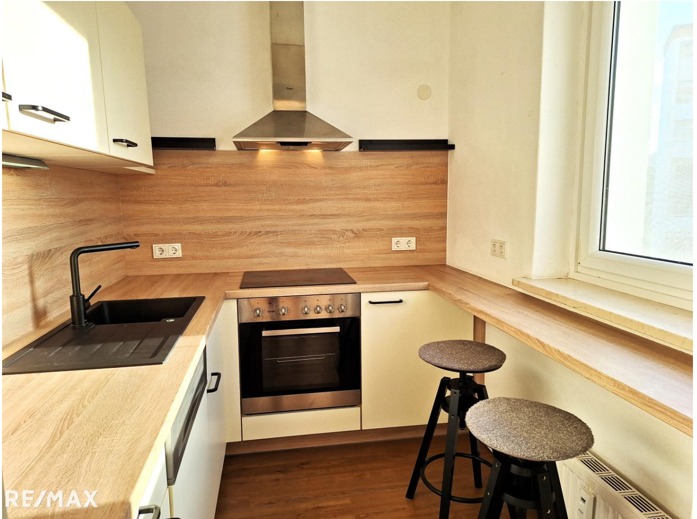
Moderne, neuwertige Einbauküche