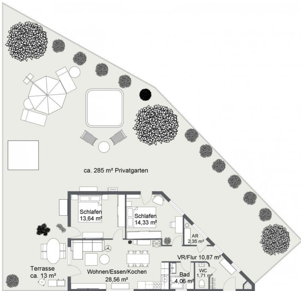
Andersengasse 17 Top 1, EG - 3-Zimmer-Gartenwohnung ca. 75,11 m²