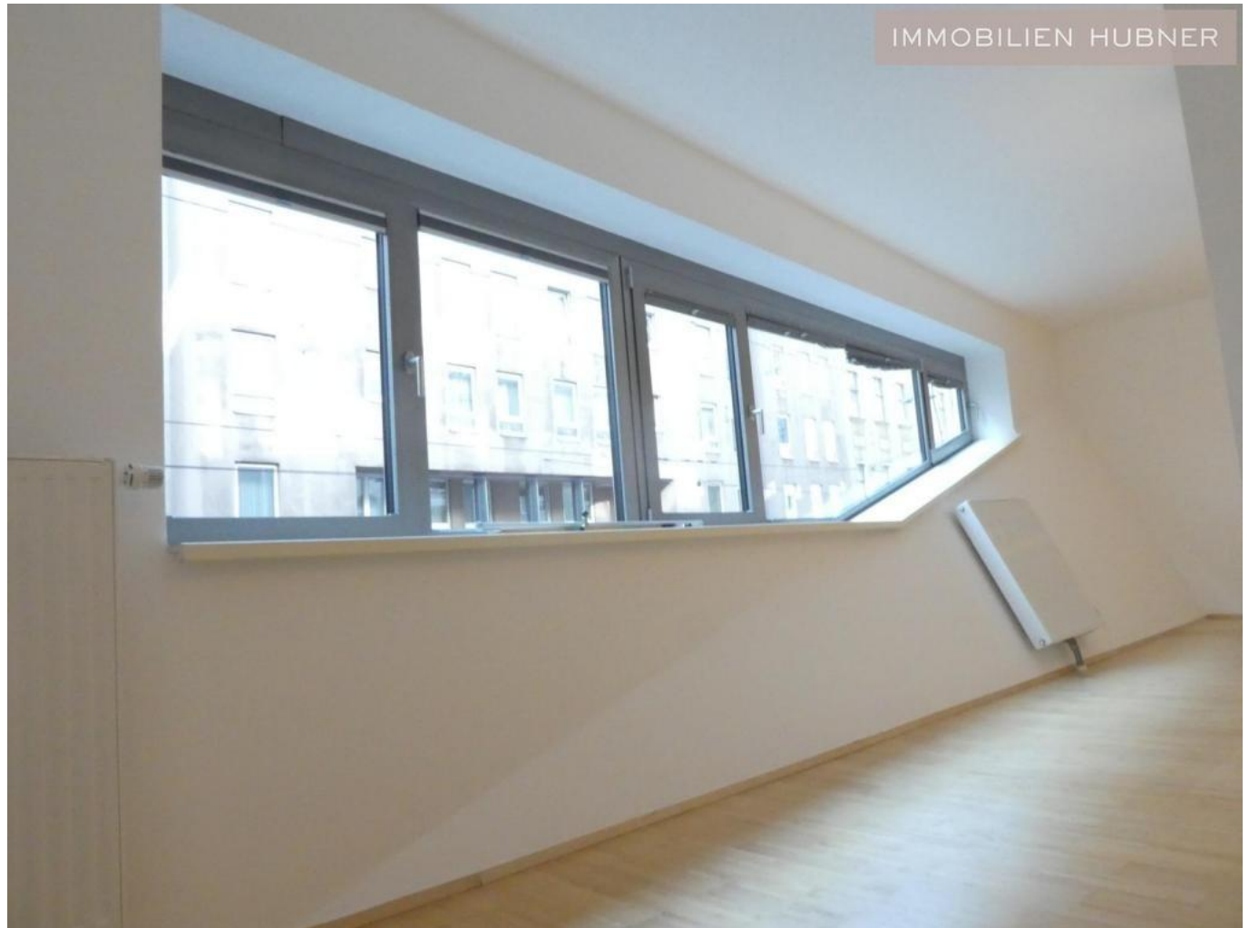
Architektenhaus, cooles Fenster