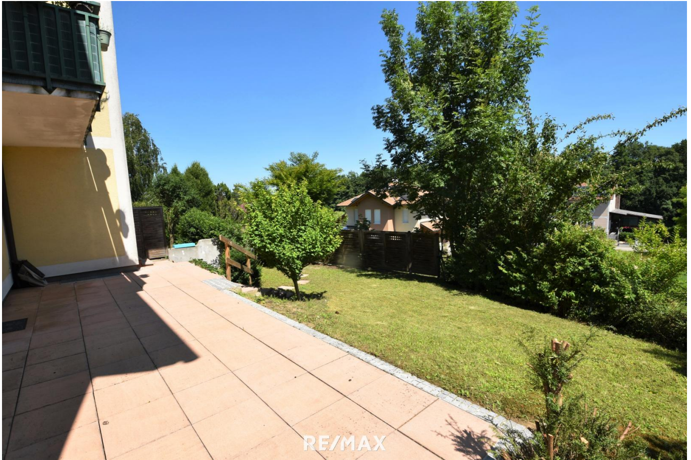
Garten und Terrasse