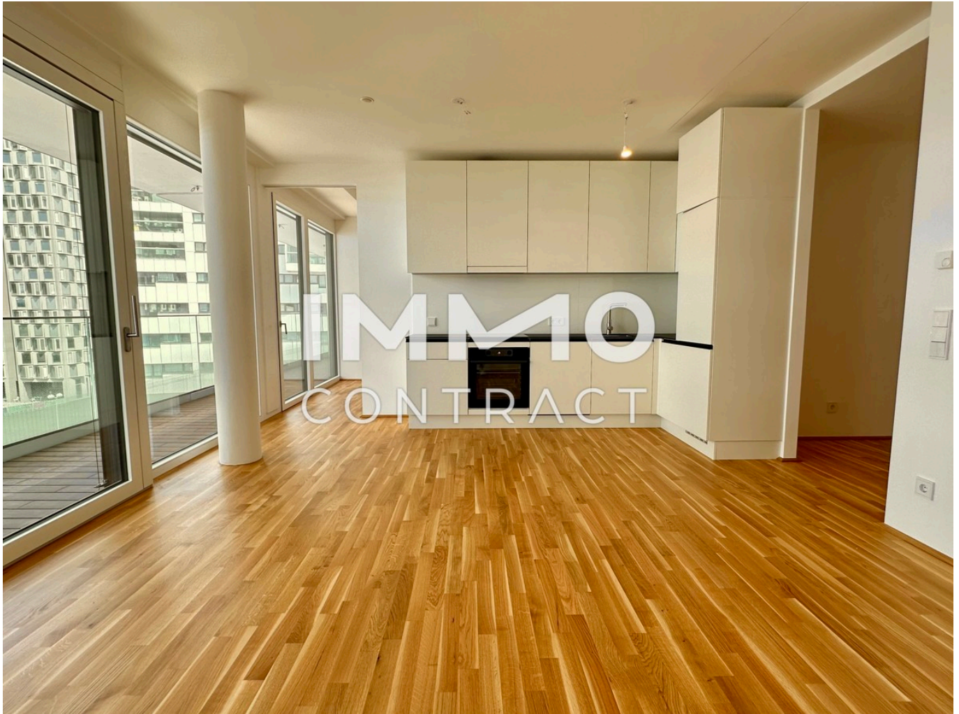
View Woküche Westseite