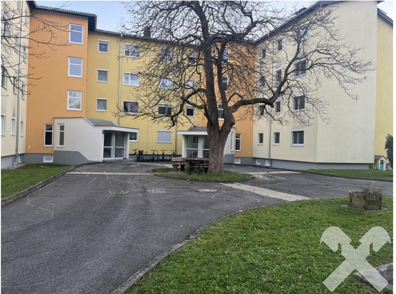
Zugang zur Wohnhausanlage