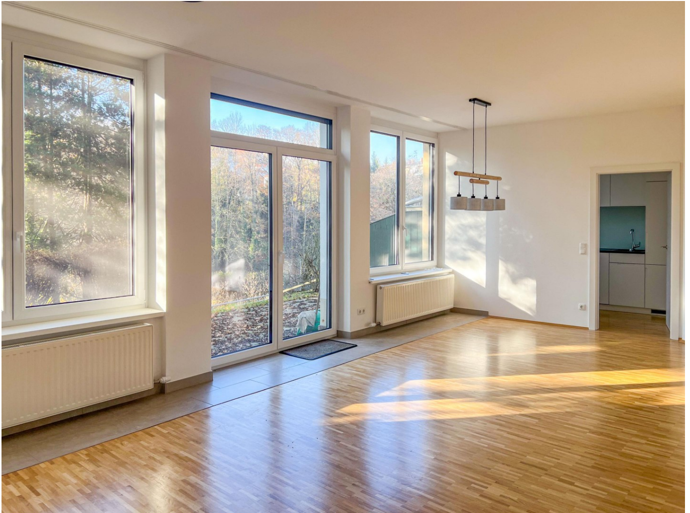
Wohn-Essbereich mit Terrassenausgang