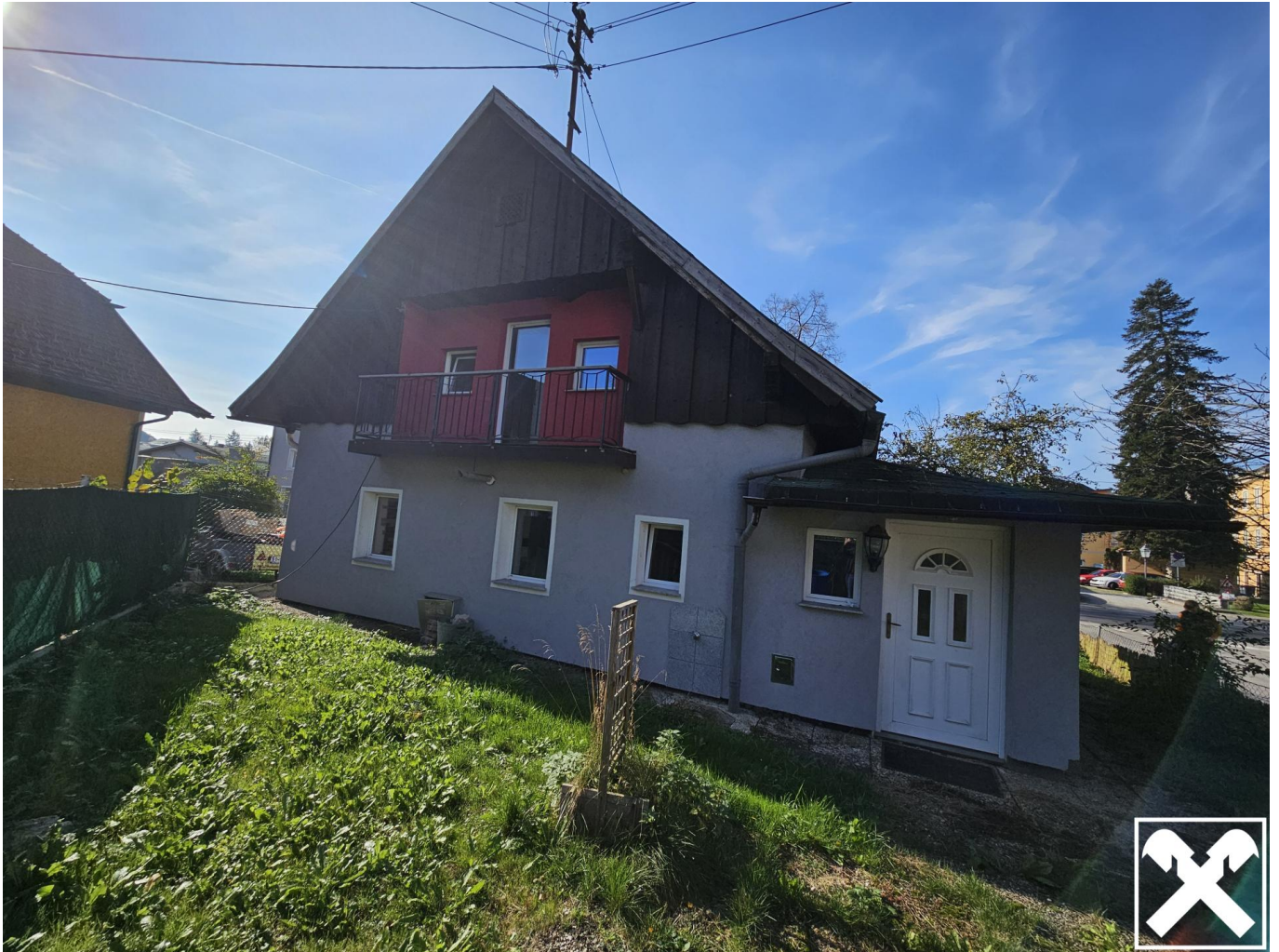
Außenansicht Garten hinten