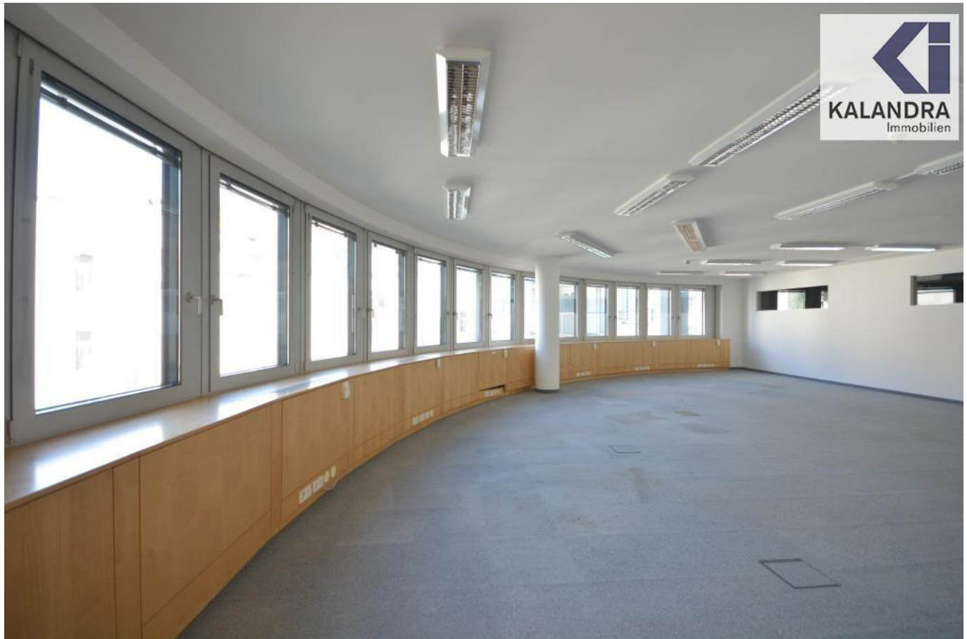
Grossraum Büro 1