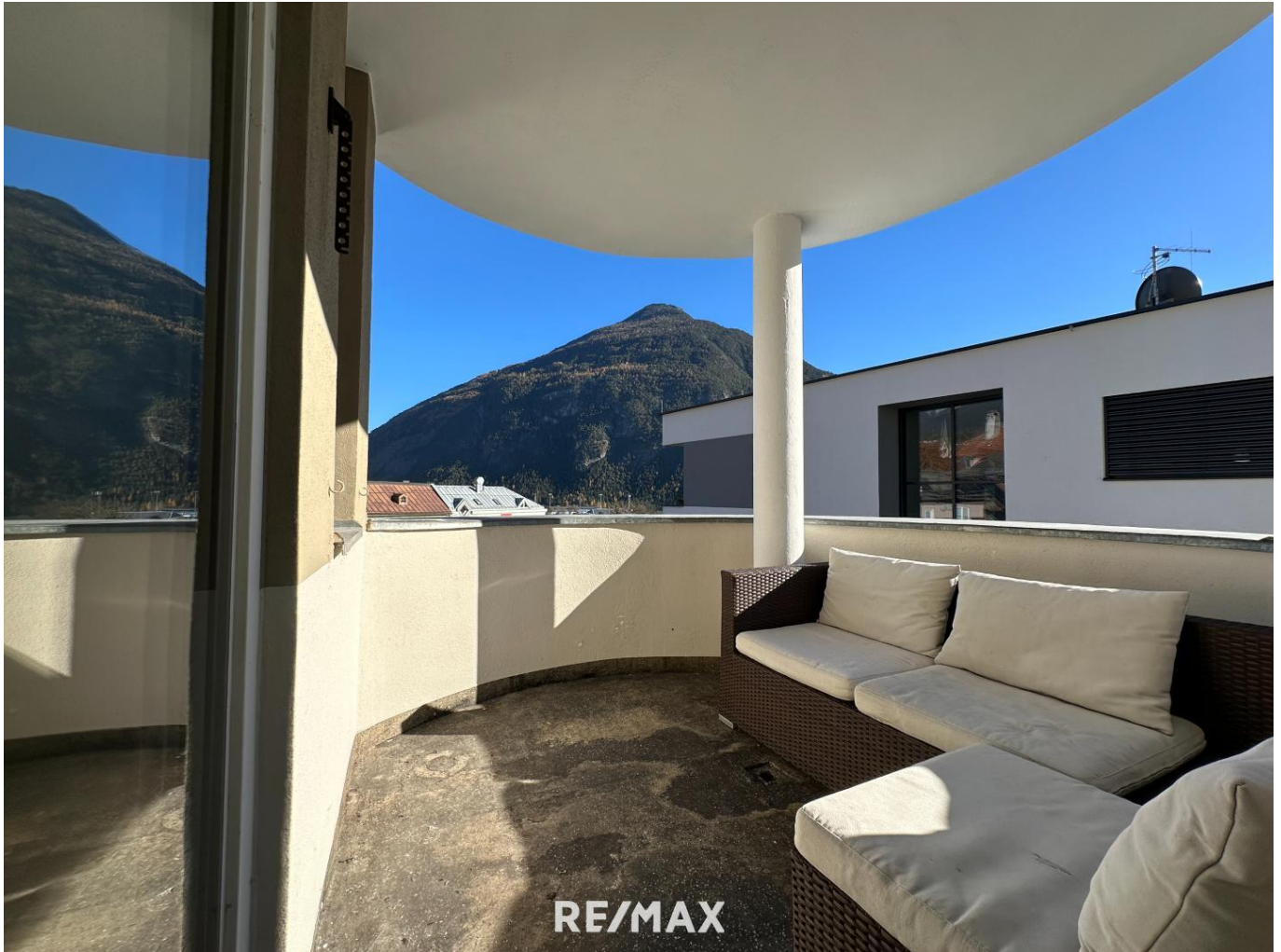
Wohnung - Imst - Terrasse