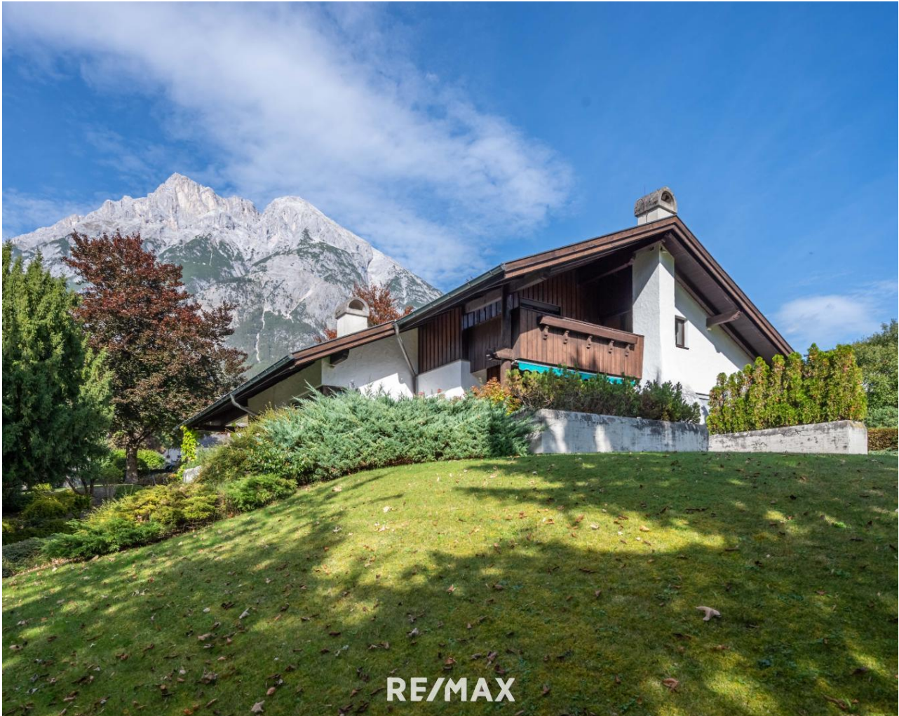
Villa in Bestlage