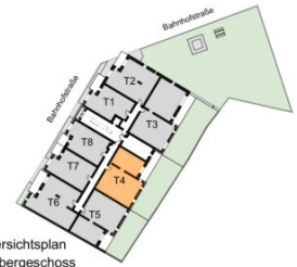
Übersichtsplan 1. Obergeschoss

Wohnfläche ca. 79,60 m 2 Balkon / Terrasse ca. 20,62 m 2 Loggia ca. 4,14 m 2 Garten ca. 58,80 m 2 Raumhöhe ca. 2,54 m