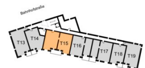
Übersichtsplan 2. Obergeschoss

Wohnfläche ca. 105,05 m 2 Loggia ca. 10,27 m 2 Raumhöhe ca. 2,54 m