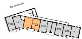
Übersichtsschoss 3. Obergeschoss

Wohnfläche ca. 105,05 m 2 Balkon / Terrasse ca. 10,33 m 2 Raumhöhe ca. 2,54 m