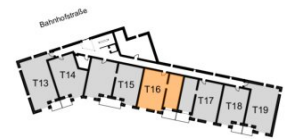
Übersichtsschoss 2. Obergeschoss

Wohnfläche ca. 78,86 m 2 Loggia ca. 6,45 m 2 Raumhöhe ca. 2,54 m