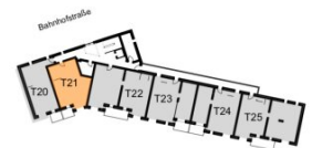
Übersichtsplan 3. Obergeschoss