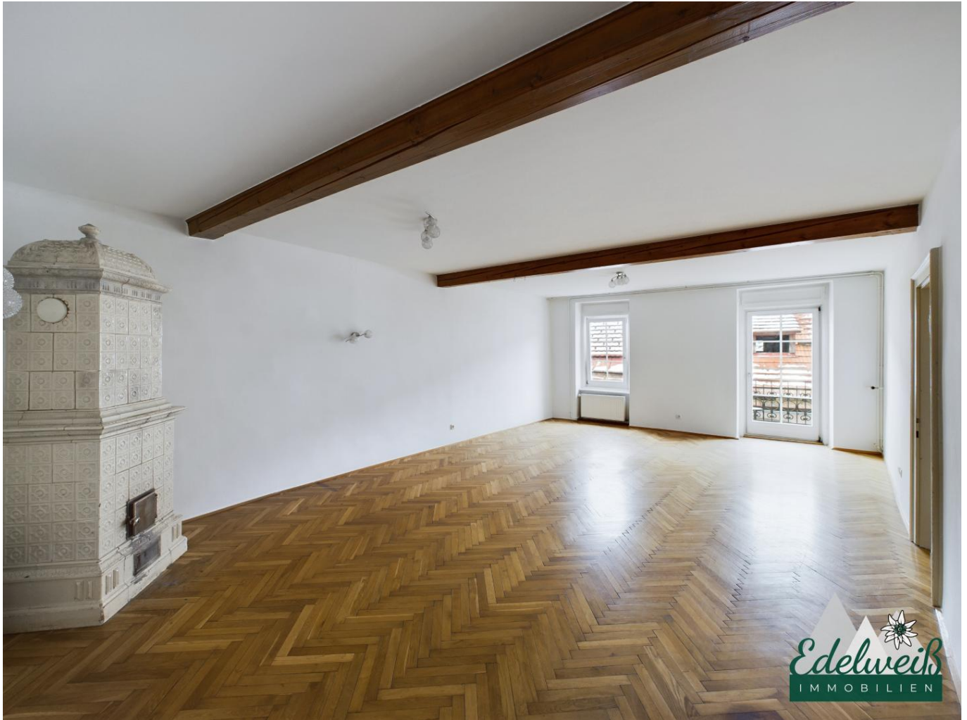
Großzügiges Wohnzimmer mit Kachelofen