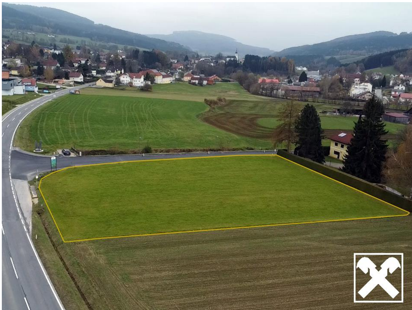
Drohnenaufnahme Grundstück - mit Kontur versehen