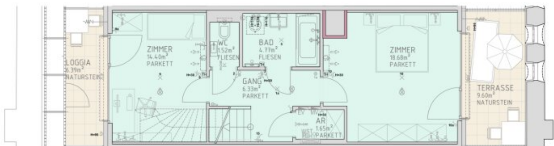
1.DACHGESCHOSS M 1:50