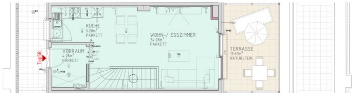
2.DACHGESCHOSS M 1:50