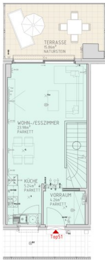
1.DACHGESCHOSS M 1:50