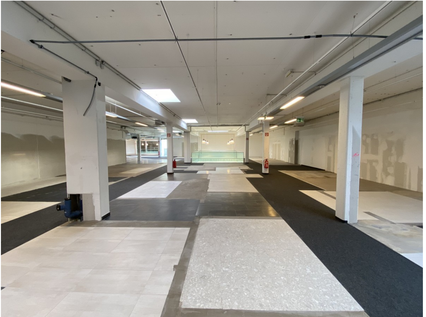
Innenansicht OG 1