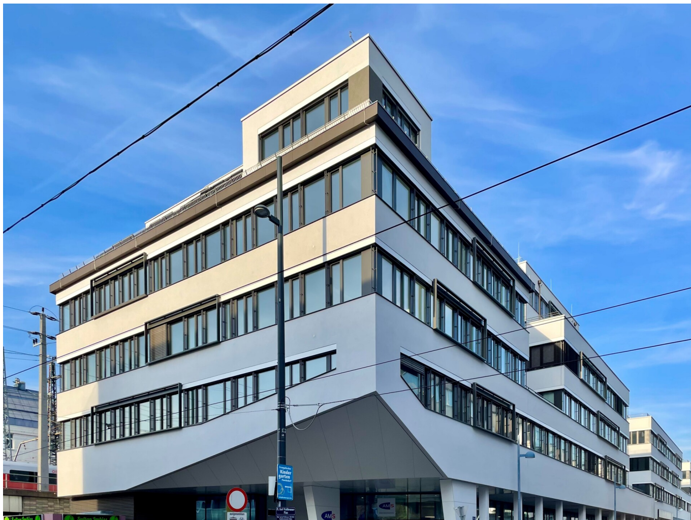
Grand Central Titelbild