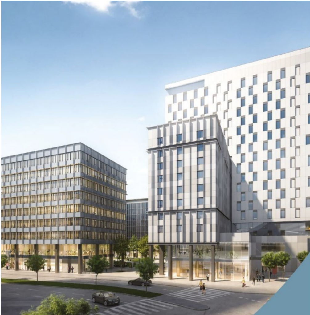
QBC - YO - Ansicht