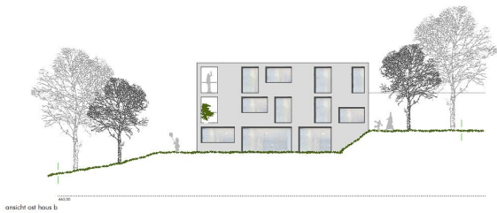
ansicht auf haus b