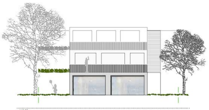
ansicht ost haus a