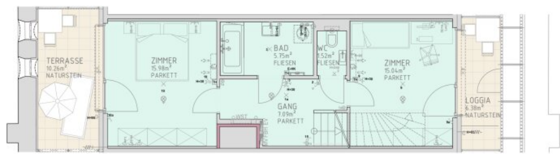
1.DACHGESCHOSS M 1:50