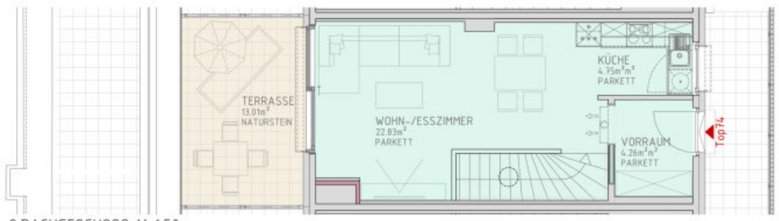
2.DACHGESCHOSS M 1:50