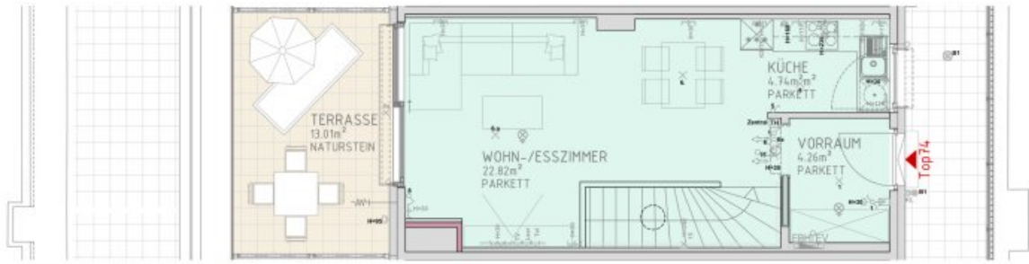
2.DACHGESCHOSS M 1:50