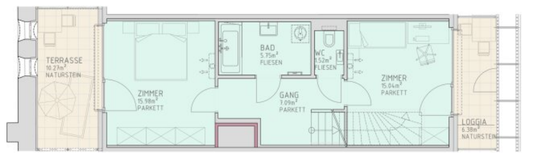
1.DACHGESCHOSS M 1:50