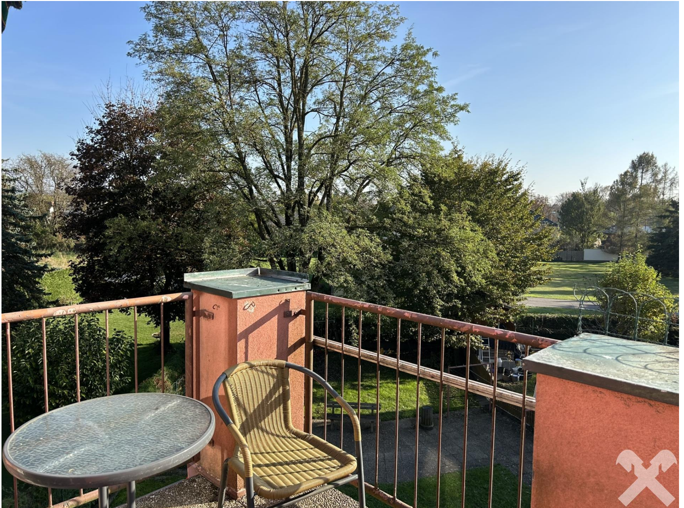
Ruhig, sonnig, mit Balkon und eigenem Garten