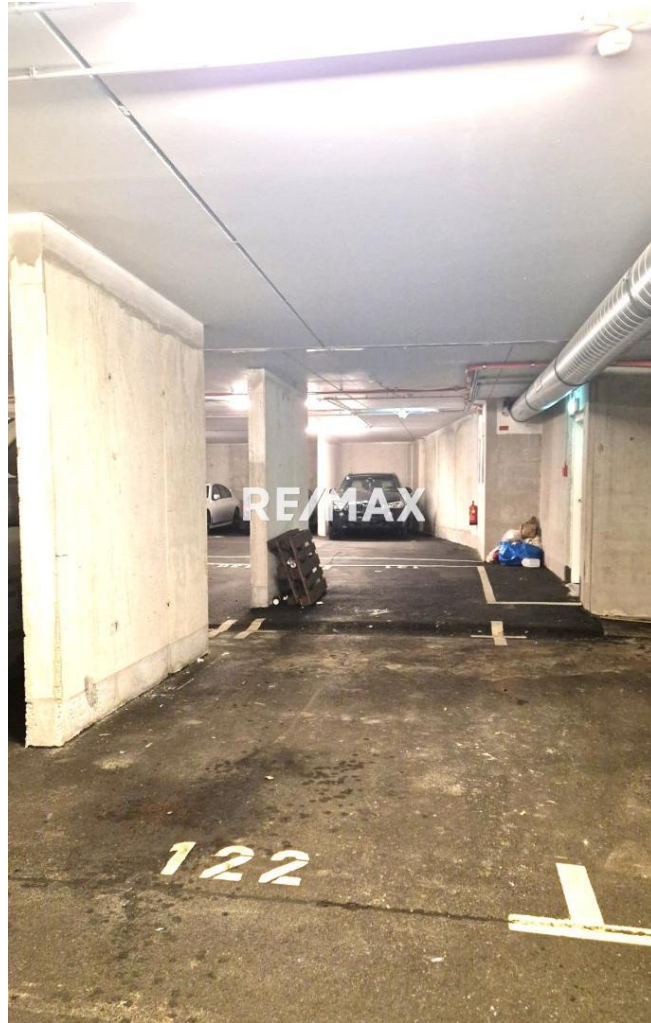
PKW Stellplatz Schwechat