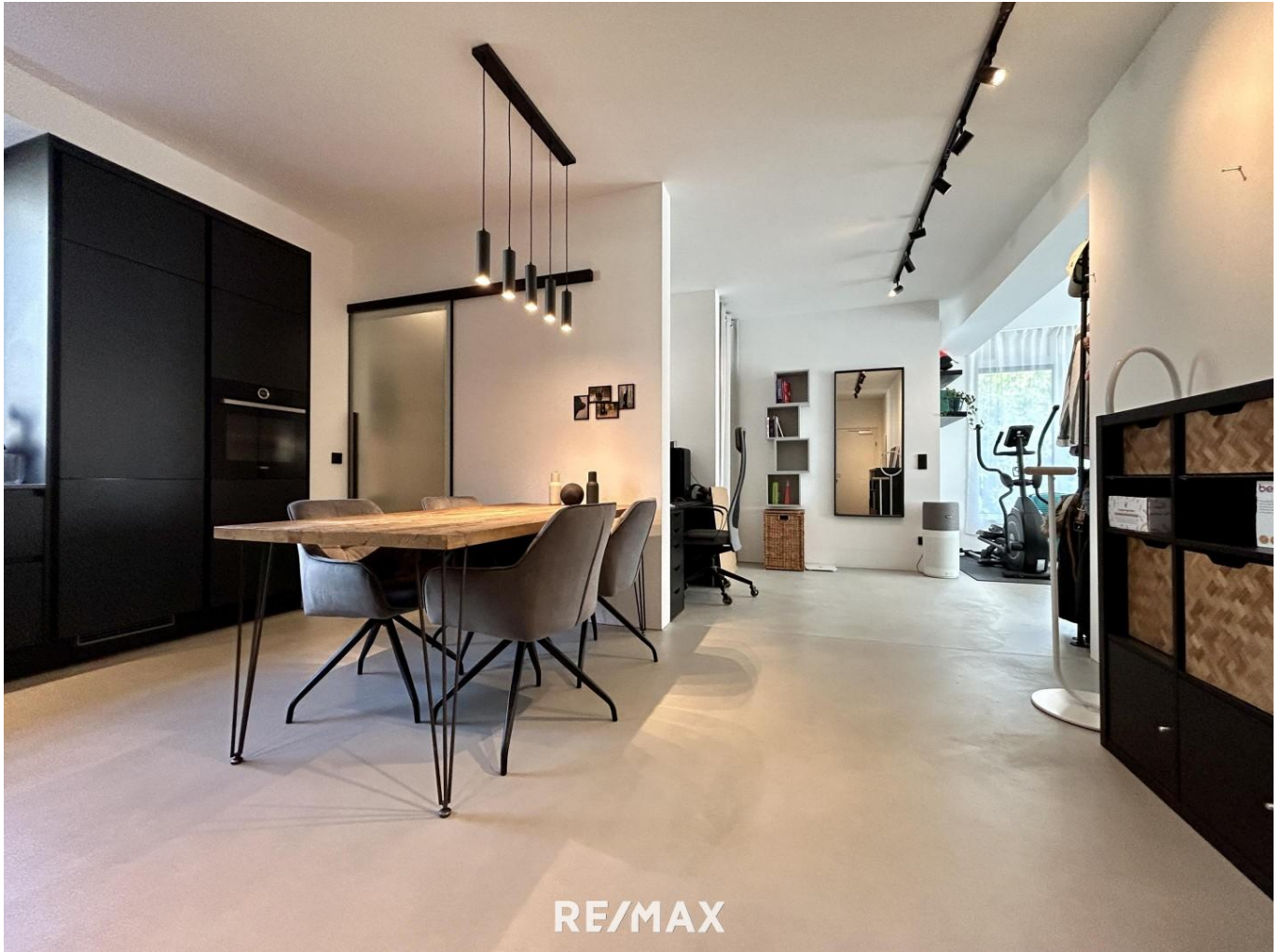
Titelbild - Symbolfoto